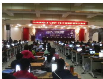
2019 合肥市第二届青少年创意编程与智能设计大赛