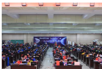
2018 合肥市首届青少年创客大赛

合肥市青少年人工智能创新实践大赛是一项着眼于切实发挥素质教育导向作用，培养具有创新创造意识的时代新人，立足本地区长期开展的一项综合性中小学科技创新赛事。致力于引导与培养青少年对科学的兴趣、了解科学知识与掌握科学方法，形成一大批具备创新创造潜质的青少年群体。为本市“大湖名城，创新高地”的建设培养更多创新型人才。