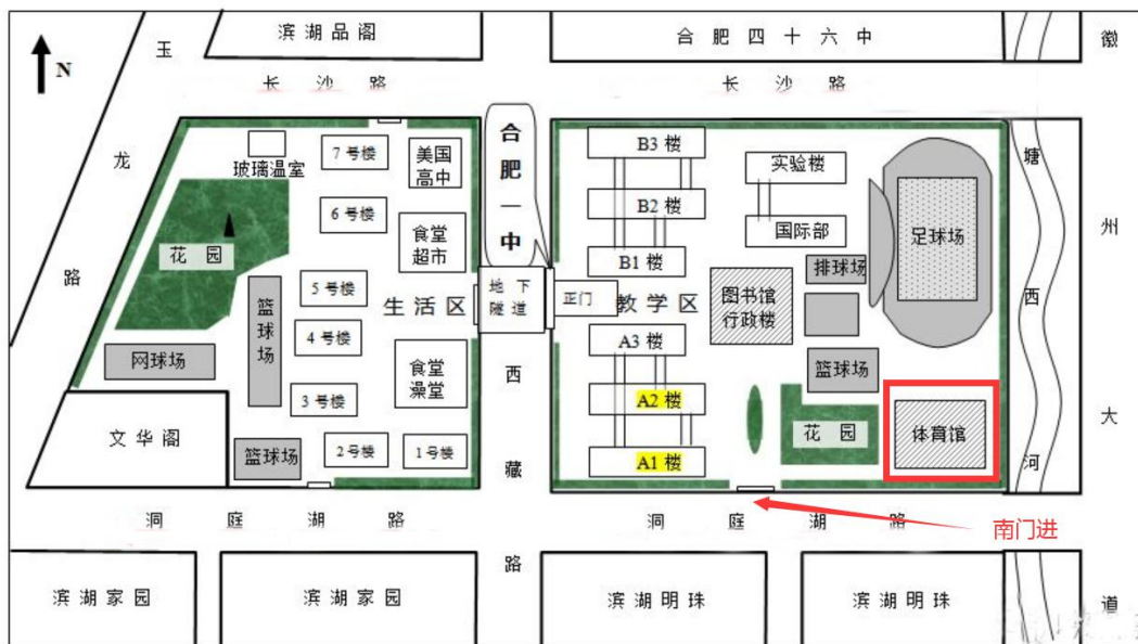
合肥一中校园平面图