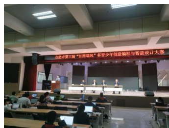
2020 合肥市第三届青少年创意编程与智能设计大赛